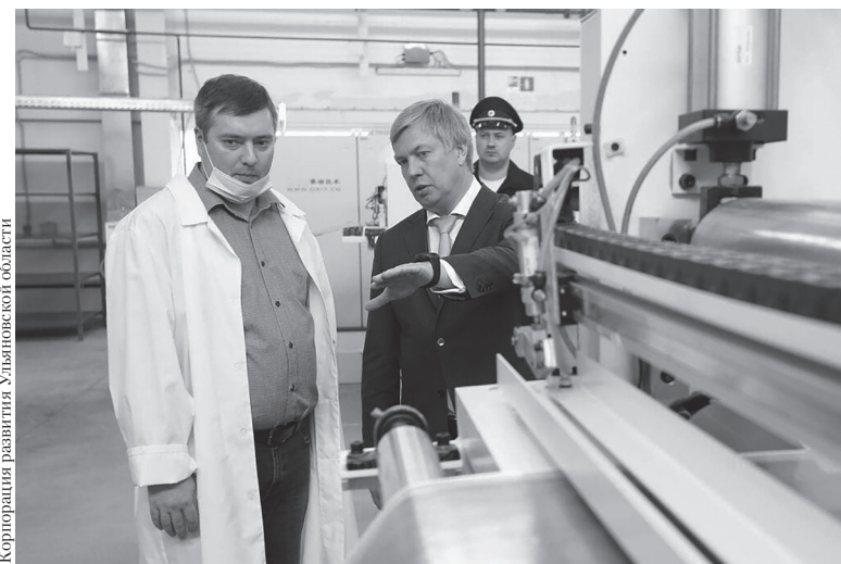
Корпорация развития Ульяновской области

«Наша площадка в Ульяновске - одно из самых современных автоматизированных производств страны, обеспечивающее высокую точность изготовления препрегов. Проект реализован при поддержке Министерства промышленности и торговли Российской Федерации и областного правительства. Мощность нового корпуса, в который вложено более 500 миллионов рублей, составит один миллион квадратных метров препрегов полимерных композиционных